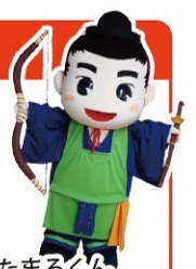
わたまるくん 矢巾町マスコットキャラクター

岩手県のほぼ中央部に位置し 美しい水と緑があふれる中で 育った農産物や自然の恵 みを最大限に活かした 特産品も豊富です