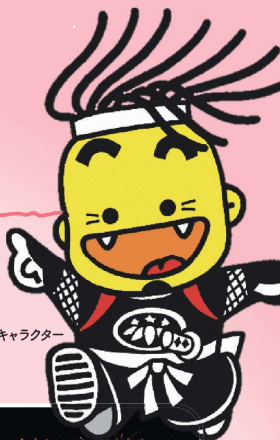
北上市観光キャラクター おに丸くん

とき 1月30日(木)・31日(金) 10:30~19:00(最終日は16:30まで) ばしょ いわて銀河プラザ 東京都中央区5丁目15-1