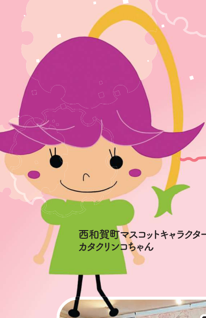
西和賀町マスコットキャラクター カタクリンコちゃん