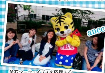
釜石シーウェイブスを応援する マスコットキャラクター 「なかりん」も参加!