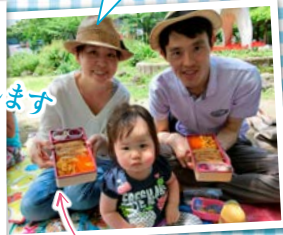
三陸弁当 (三浦屋・盛岡市)