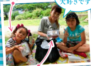
まめごろろう(小松製菓・二戸市)