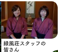
緑風荘スタッフの皆さん