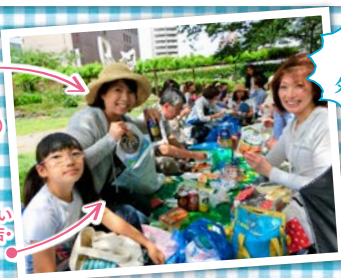
山田せんべい (太田幸商店・ 山田町)