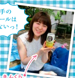
きんくら (いわて蔵ビール・一関市)